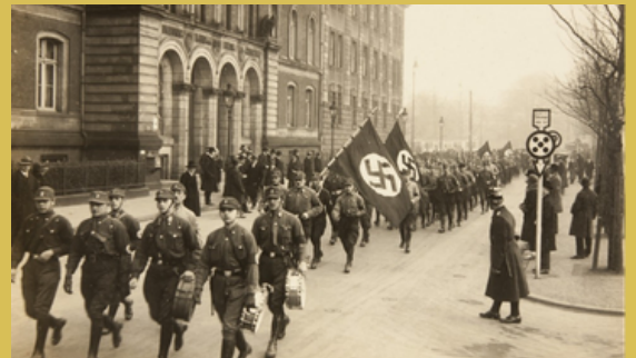
Membros das SA na cidade de Duisburg, durante um comício nazi c.1928.

Num episódio conhecido como a “Noite das Facas Longas”, a 30 de junho de 1934, cerca de cem vítimas, incluindo Röhm e outros líderes das SA, bem como diversas figuras que Hitler entendeu afastar, foram presas e executadas. As SS ( Schutzstaffel ), uma subunidade das SA, cometeram a maior parte dos assassinatos, passando a assumir e alargar as funções das SA, tal como a gestão de campos de concentração e de extermínio.