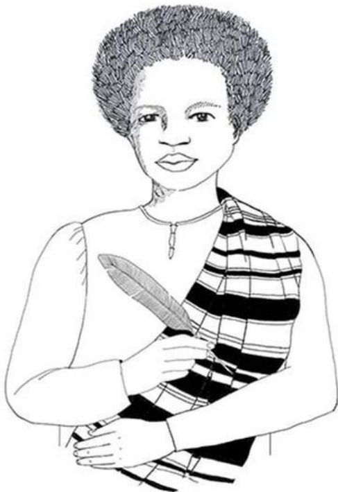
Imagem 6: Ilustração de Esperança Garcia